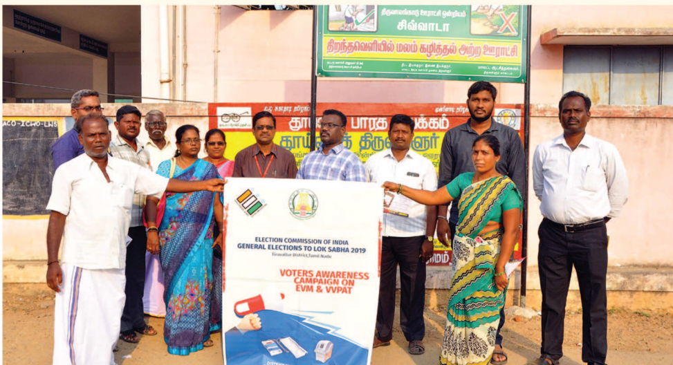
Jaladhi foundation 6th event "Voters awareness campaign on EVM & VVPAT" rally conducted for awareness of election and responsibility of every citizen as voter in thiruvallur district.