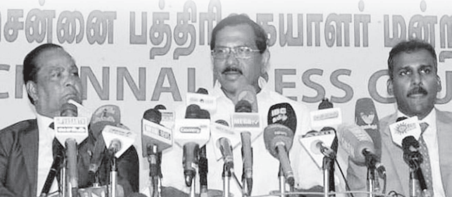
ஐந்தாம் உலகத் தமிழ் ஆராய்ச்சி மாநாடு

தமிழினம், தமிழ்மொழி, இலக்கியம், பண்பாடு, நாகரிகம் ஆகியவற்றின் தொன்மை, தற்கால இலக்கியம் குறித்து புதுவரலாற்றின் நோக்கிலும், அறிவியல் அடிப்படையிலும் ஆய்வு செய்ய வேண்டும் என்பது இந்த மாநாட்டின் மையப்பொருளாக வைக்கப்பட்டு இருக்கிறது என்றார்.