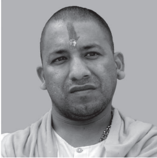
யோகி ஆதித்யநாத் அதிரடி?