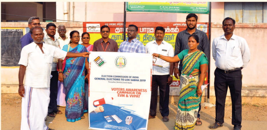
Jaladhi foundation 6th event "Voters awareness campaign on EVM & VVPAT" rally conducted for awareness of election and responsibility of every citizen as voter in tiruvallur district.